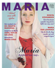
MARIA, DE GLOSSY

In 1444 vond er in Amersfoort een wonder rond een sober Mariabeeldje plaats. De stad werd een bedevaartsoord waar mensen heentrokken om Maria te danken of om hulp te vragen. Anno 2011 is Maria nog steeds populair. Het grote aantal mensen dat al een bezoek bracht aan de tentoonstelling Maria, idool van alle tijden , is daar een bewijs van. Sinds de opening op 10 juli kwamen er meer dan 8.000 mensen naar de tentoonstelling in Museum Flehite. Een bijna even groot aantal mensen keek op de website www.idoolvanalletijden.nl om er een kaarsje te branden, een Mariafoto te plaatsen of om de activiteitenagenda te bekijken.